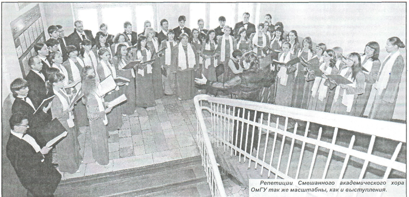
Репетиции Смешанного академического хора ОмГУ так же масштабны, как и выступления.