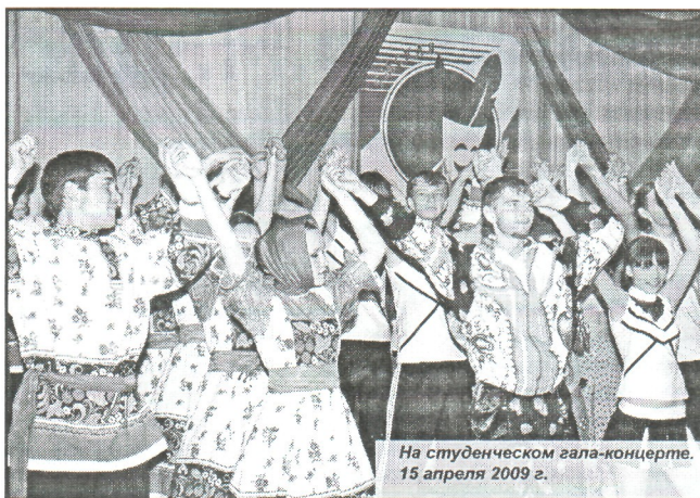
На студенческом гала-концерте. 15 апреля 2009 г.

личных городах страны. Несколько раз университет выступал организатором республиканских и межрегиональных научных студенческих конференций – их проводили археологи, физики, этнографы, юристы и др. Участие в Федеральной целевой программе «Интеграция» позволило получить в 2002 г. финансирование на проведение студенческой конференции «Молодежь III тысячелетия», которая затем стала проводиться регулярно.